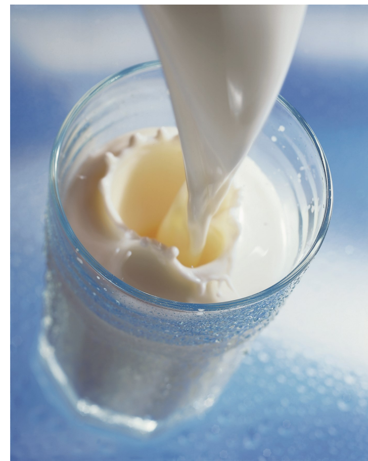
Stand: Januar 2017

Quellen: aid infodienst Ernährung, Landwirtschaft, Verbraucherschutz e.V. BMWi - Bundesministerium für Wirtschaft und Technologie Bundesagentur für Arbeit Milchindustrie-Verband e.V.